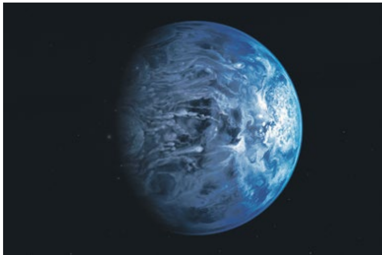
Vue d'artiste de la planète géante gazeuse HD189733b, découverte en 2005.

Vue depuis la Terre, la planète HD189733b présente la particularité