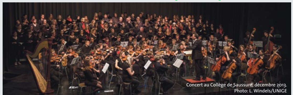
Concert au Collège de Saussure, décembre 2013.