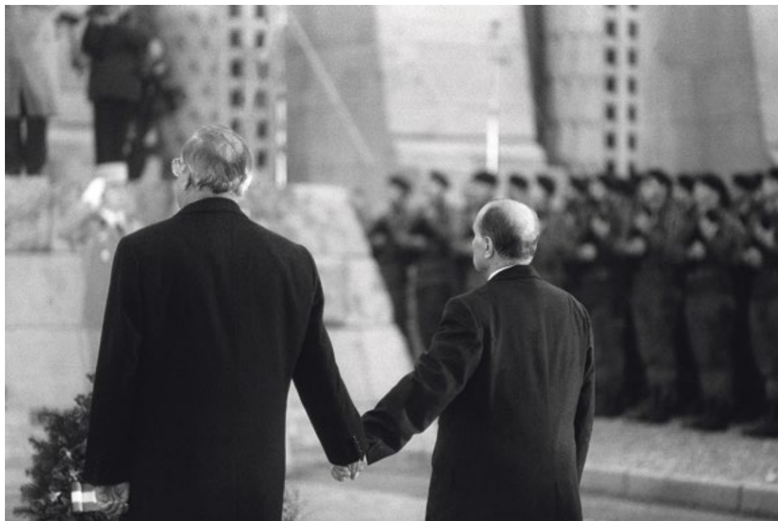
François Mitterrand et Helmut Kohl, le 22 septembre 1984, près de Verdun.