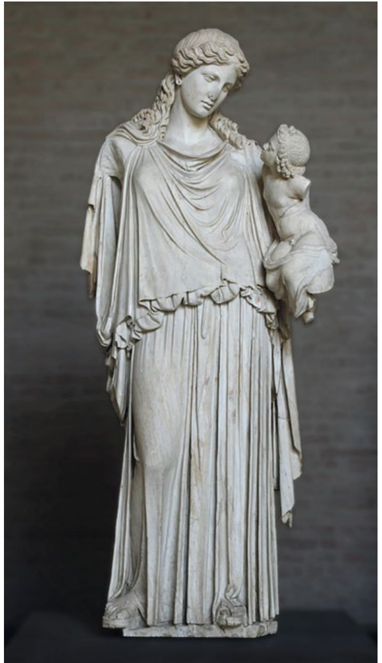
Statue d'Eiréné (la Paix) portant Ploutos (la Richesse). Cette œuvre constitue l'une des rares représentations antiques figurant la paix connue à ce jour.

C'est vrai. Chez Homère, dans l'Illiade en particulier, guerre et paix sont indissociables, mais la paix est présentée comme un idéal. Chez Héraclite, la paix sans guerre n'existe pas. Le rêve d'une paix universelle serait aux antipodes de la pensée. Plus tard, chez saint Augustin, on se prend à imaginer une paix future, sans guerre. Toutefois, le christianisme va évoluer au fil du temps et va générer d'autres courants de pensée, influençant des auteurs comme Nietzsche. Ce que l'on constate, c'est