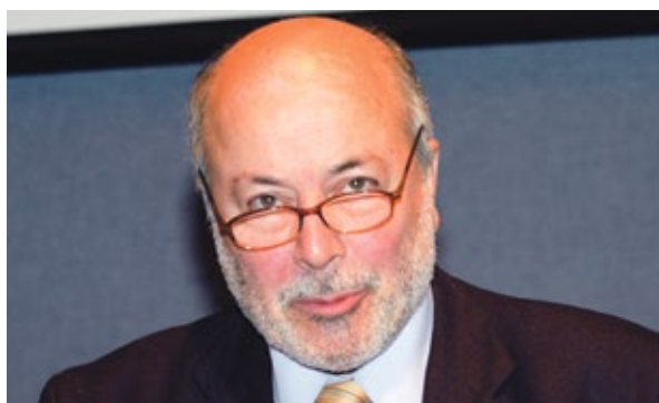
Juan Guzmán Tapia lors de la remise du prix Letelier Moffit Human Rights Award, en 2005.

Durant les dix-sept années de la dictature, le Chili a vécu au rythme effréné des arrestations illégales, des assassinats, des disparitions forcées et des cas de torture. Le bilan est désastreux: plus de 3100 homicides, plus de 1200 disparitions forcées, et, au final, plus de 35 000 personnes torturées, ceci indépendamment d'autres violations des droits humains. Or, après le plébiscite qui mit fin à la