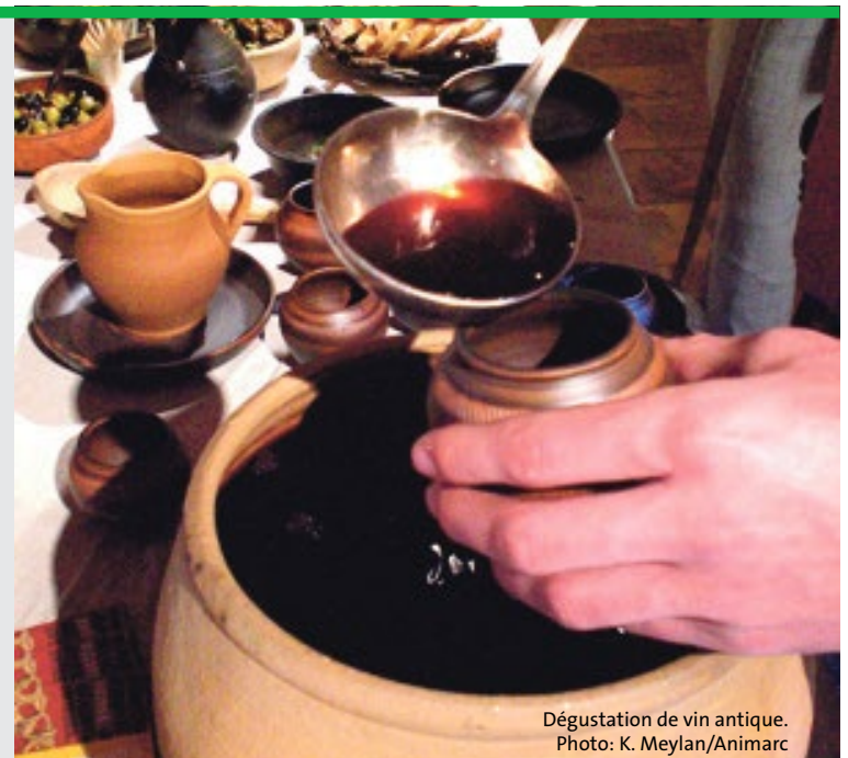
Dégustation de vin antique.